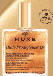
Huile Prodigieuse® Or