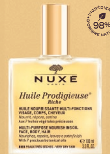
Huile Prodigieuse® Riche