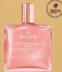
Huile Prodigieuse® Or Florale