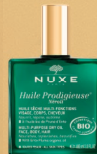
Huile Prodigieuse® Nérol