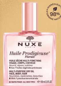
Huile Prodigieuse® Florale